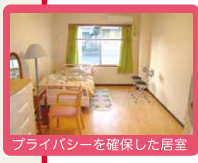
プライバシーを確保した居室

全室個室でプライバシーを確保。 慣れ親しんだ家具等もお持ち込みいただいて 自由にレイアウトが可能です。