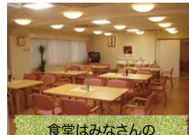
食堂はみなさんの交流スペース