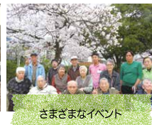
さまざまなイベント