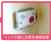
ベッドの脇には緊急通報装置