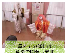
屋内での催しは 食堂で開催します