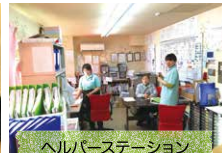
ヘルパーステーション 夜間も職員が常駐します