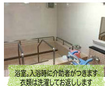
浴室。入浴時に介助者がつきます 衣類は洗濯してお返しします