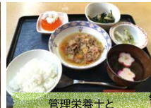
管理栄養士と専門調理師による食事