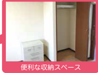
便利な収納スペース