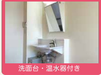
洗面台・温水器付き