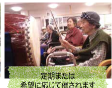
定期または希望に応じて催されます