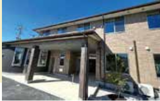
居室間取り (例) 18.60㎡

全室個室でプライバシーを確保。 慣れ親しんだ家具等もお持ち込みいただいて 自由にレイアウトが可能です。