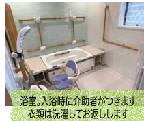
浴室。入浴時に介助者がつきます衣類は洗濯してお返します