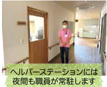
ヘルパーステーションには夜間も職員が常駐します