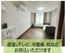
居室。テレビ、冷蔵庫、机などお持ちいただけます