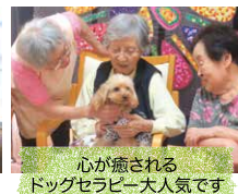
心が癒されるドッグセラピー大人気です