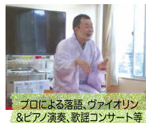
プロによる落語、ヴァイオリン&ピアノ演奏、歌謡コンサート等