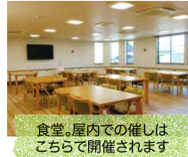
食堂。屋内での催しはこちらで開催されます