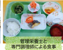
管理栄養士と専門調理師による食事