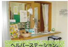
ヘルパーステーション。夜間も職員が常駐します。