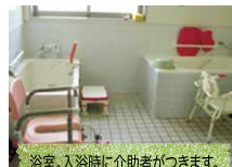
浴室。入浴時に介助者がつきます。衣類は洗濯してお返します。