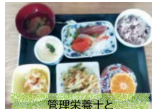
管理栄養士と専門調理師による食事