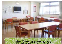
食堂はみなさんの交流スペース