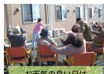
お天気の良い日は外で体操