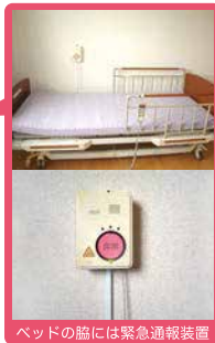
ベッドの脇には緊急通報装置