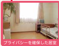
プライバシーを確保した居室

全室個室でプライバシーを確保。 慣れ親しんだ家具等もお持ち込みいただいて 自由にレイアウトが可能です。