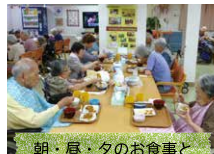
朝・昼・夕のお食事とおやつ時間を設けています