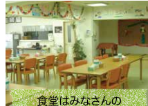
食堂はみなさんの交流スペース