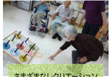
さまざまなレクリエーション