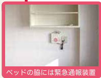
ベッドの脇には緊急通報装置

全室個室でプライバシーを確保。 慣れ親しんだ家具等もお持ち込みいただいて 自由にレイアウトが可能です。