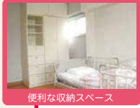
便利な収納スペース