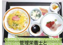
管理栄養士と専門調理師による食事