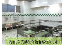
浴室、入浴時に介助者がつきます 衣類は洗濯してお返します