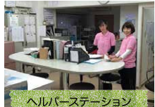
ヘルパーステーション 夜間も職員が常駐します