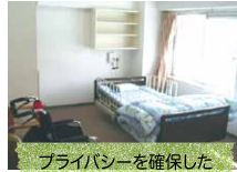
プライバシーを確保した居室