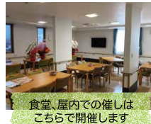
食堂、屋内での催しはこちらで開催します