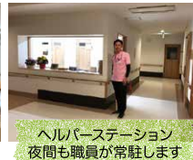
ヘルパーステーション 夜間も職員が常駐します