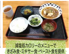
減塩低カロリーのメニューで、きざみ食・ミキサー食・ペースト食を提供