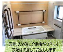
浴室、入浴時に介助者がつきます 衣類は洗濯してお返しします