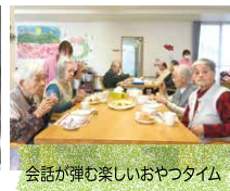
会話が弾む楽しいおやつタイム