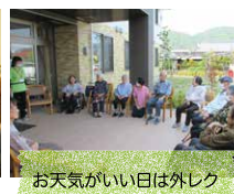
お天気の良い日は外レク