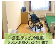
居室、テレビ、冷蔵庫、机などお持ちいただけます