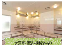
大浴室・個浴・機械浴あり 浴室の入浴時に介助者がつきます