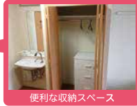
便利な収納スペース