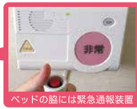
ベッドの脇には緊急通報装置