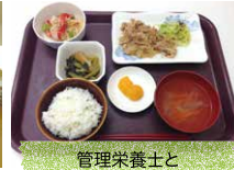
管理栄養士と専門調理師による食事