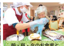
朝・昼・夕のお食事とおやつ時間を設けています