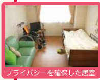
プライバシーを確保した居室

全室個室でプライバシーを確保。 慣れ親しんだ家具等もお持ち込みいただいて 自由にレイアウトが可能です。