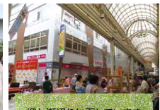
柳ヶ瀬通りに面しています