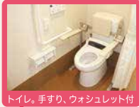
トイレ、手すり、ウォシュレット付