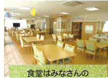
食堂はみなさんの交流スペース