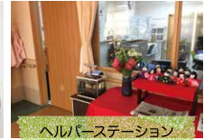
ヘルパーステーション 夜間も職員が常駐します