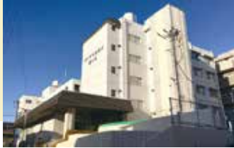
居室間取り (例) 13.50㎡

全室個室でプライバシーを確保。 慣れ親しんだ家具等もお持ち込みだいて 自由にレイアウトが可能です。