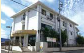
居室間取り (例) 13.50㎡

全室個室でプライバシーを確保。 慣れ親しんだ家具等もお持ち込みいただいて 自由にレイアウトが可能です。