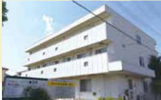
居室間取り (例) 16.50㎡

全室個室でプライバシーを確保。 慣れ親しんだ家具等もお持ち込みいただいて 自由にレイアウトが可能です。